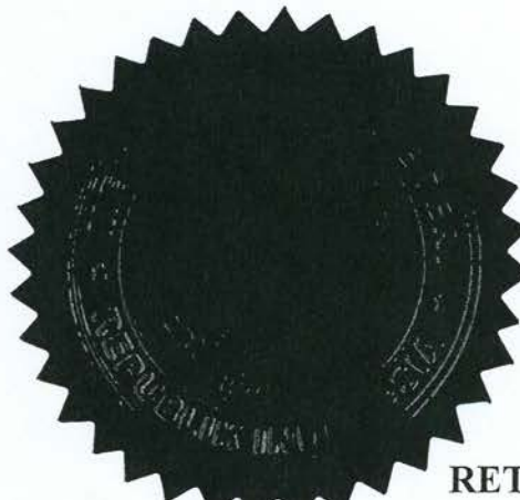
RETNO L. P. MARSUDI

DIBUAT di Jakarta pada tanggal delapan bulan Januari tahun dua ribu enam belas.